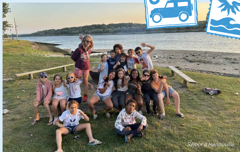
Séjour à Hérouville

15 jeunes de la 6 e à la 3 e ont participé à un mini-camp à Jumièges, mêlant activités sportives (paddle, tyrolienne, VTT, tir à l'arc...) et animations variées